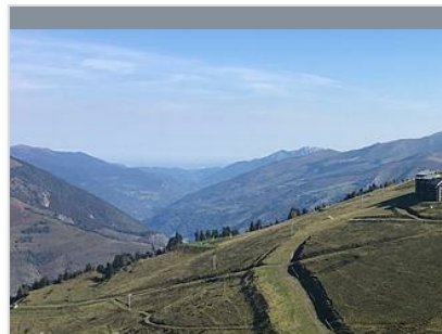
TABLE D'ORIENTATION DE SUPERBAGNERES